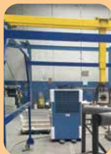
progetti congiunti di ricerca e sviluppo