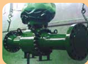
rivestimenti epossidici per valvole subsea