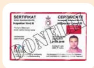
6 ispettori FROSIO