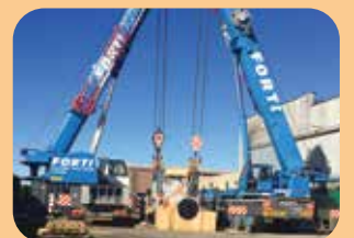
movimentazione pezzi pesanti fino a 150 ton.