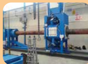
gestione impianti di verniciatura presso clienti