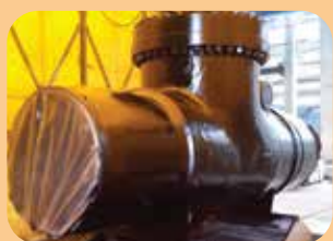
rivestimenti poliuretanic per valvole interrte