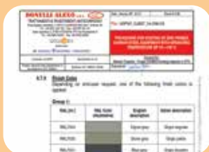
preparazione di specifiche di verniciatura