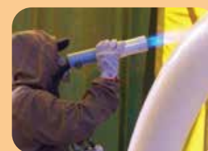
sistemi FBE + PP e PE applicato per flame spray