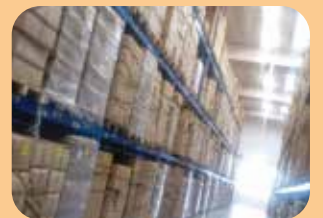
Stoccaggio e servizi doganali

Packaging in collaborazione con Tecno Imballi, disponibile brochure dedicata.