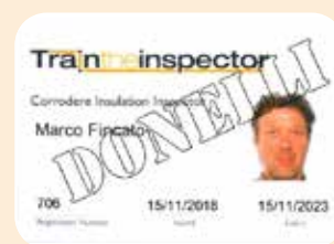
1 ispettore CORRODERE