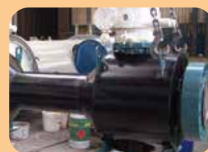
rivestimenti poliuretanic per valvole deep sea