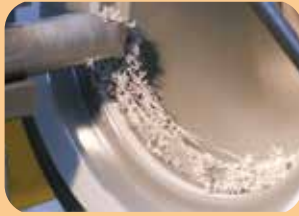
lining rilavorabili a macchina