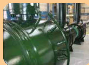
rivestimenti epossidici/poliuretanic per valvole interrte