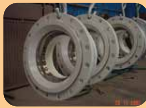
rivestimenti per uso alimentare