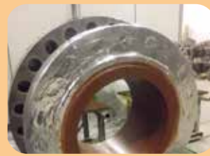
rivestimenti epossifenolici per alte temperature