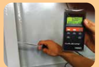
ispezioni e collaudi con ispettori NACE / FROSIO / CORRODERE