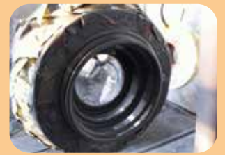
FBE (Fusion Bonded Epoxy)