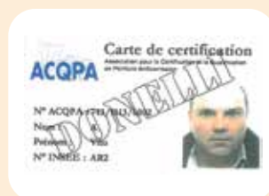
35 applicatori ACQPA