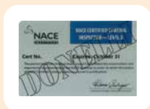
12 ispettori NACE