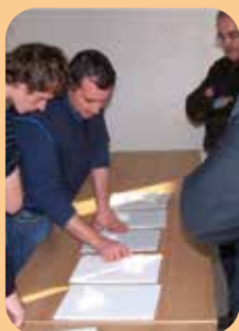
formazione tecnica e pubblicazioni