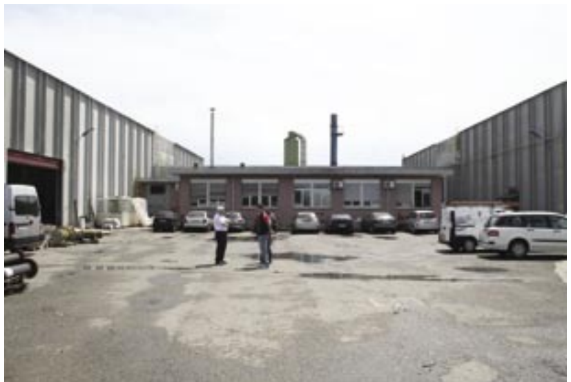
Fig. 1 - La Donelli Alexo a Cuggiono, in provincia di Milano

Nel 2002 l'azienda ha ottenuto la licenza esclusiva per l'Italia per l'applicazione di prodotti Säkaphen per il