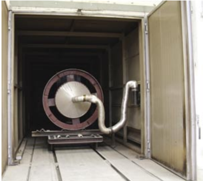
Fig. 12 - Il raffreddamento dello scambiatore dopo la polimerizzazione

lo raffreddiamo con il raffreddatore che aspira aria calda dall'interno del serbatoio e la convoglia sul cielo del forno (fig. 12)».