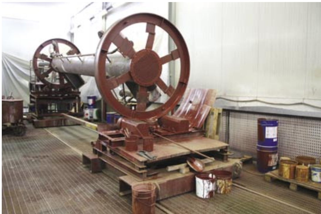
Fig. 11 - Uno scambiatore di calore durante l'applicazione del rivestimento con tecnologia Säkaphen

contenitori per l'industria vinaria, alimentare e farmaceutica.