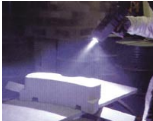
Fig. 13 - L'operazione di metallizzazione, a filo di un manufatto

ad elevata temperatura – ha proseguito Bruno Picoltrini – il processo da noi utilizzato consente elevata velocità di deposizione, alte temperature di fusione, e conseguentemente elevati valori