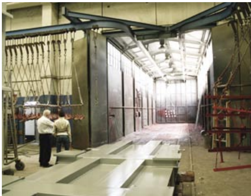
Fig. 9 - La cabina di verniciatura aperta per la movimentazione verso l'esterno con trasportatori dei pezzi verniciati: a destra e a sinistra di figura