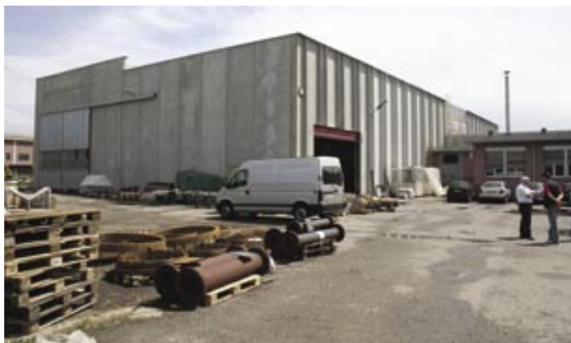
Figg. 6 e 7 - I due capannoni dell'azienda con il grande piazzale per la movimentazione. Sulla sinistra si intravede anche il magazzino vernici