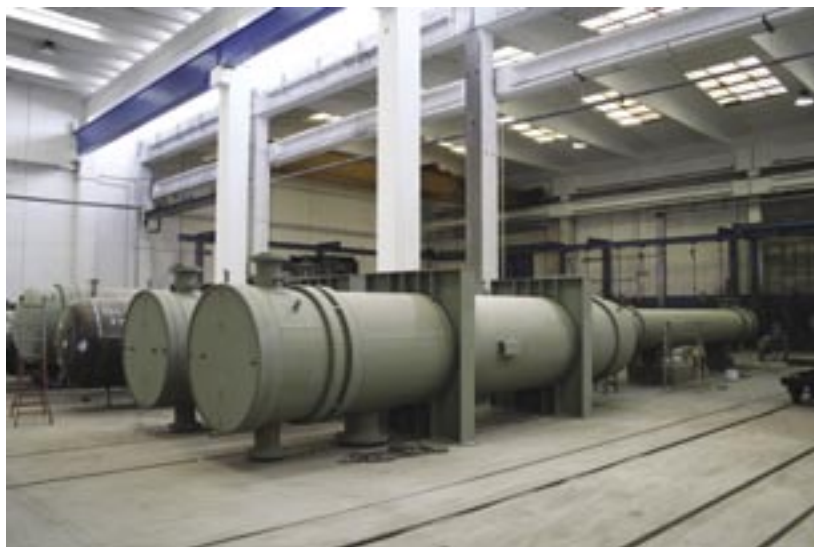
Figg. 3 e 4 - Gli scambiatori di calore rivestiti internamente dalla Alexo con tecnologia Säkaphen: all'esterno le superfici metalliche sono rivestite con zincanti inorganici prima della consegna all'utente