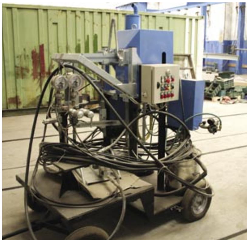
Fig. 10 - L'apparecchiatura Bimixer di spruzzatura di pitture vinilesteri, senza solventi e ad alto solido