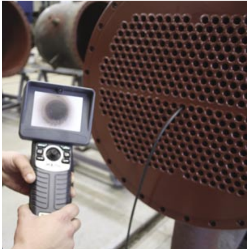
Fig. 15 - Il videoendoscopio a fibre ottiche per il controllo qualitativo del rivestimento interno degli scambiatori di calore

clienti per una corretta progettazione e cura dei particolari costruttivi, che è di fondamentale importanza per una applicazione corretta e duratura di un rivestimento interno. Così, per il rivestimento con tecnologia Säkaphen fin dall'inizio può essere fatto riferimento allo standard Nace RP-0178 o alla norma DIN 28 051:1990. Allo stesso modo un grado di pulizia SSPC-SP 5:1994, Sa 3, con un idoneo profilo di ancoraggio, è condizione indispensabile per assicurare l'adesione